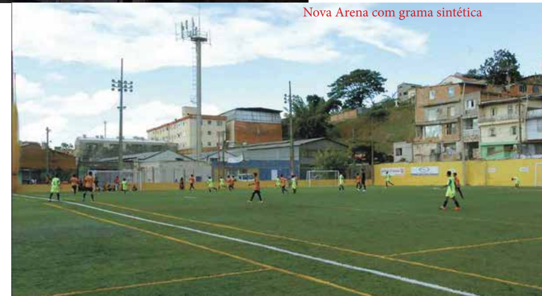
Nova Arena com grama sintética