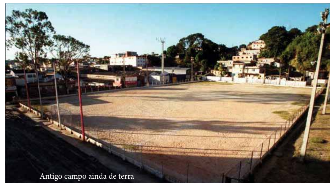
Antigo campo ainda de terra

A Sintetic Bool tem escolas de futebol, realiza competições em parceria com os grandes clubes do Brasil, realiza promoções de eventos e locação de quadras sintéticas.